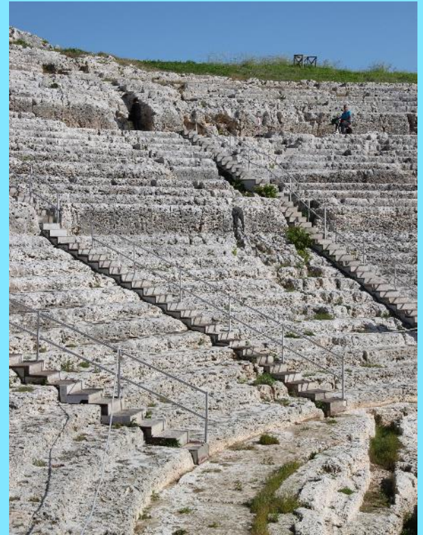
Das römische Amphitheater aus dem 3. Jahrhundert n. Chr. ist 140 m lang und 119 m breit. Der Bühnenraum ließ sich mit Wasser füllen, so dass hier auch Seeschlachten nachgestellt werden konnten.