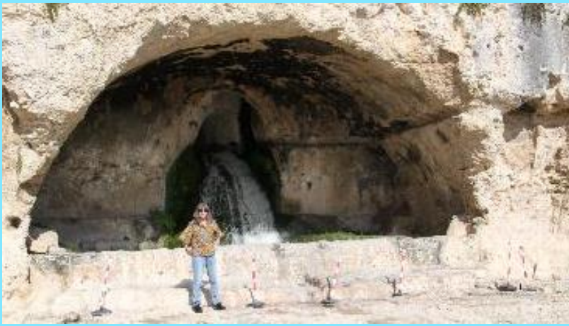
Eigene Wasserfassung innerhalb des Amphitheaters.