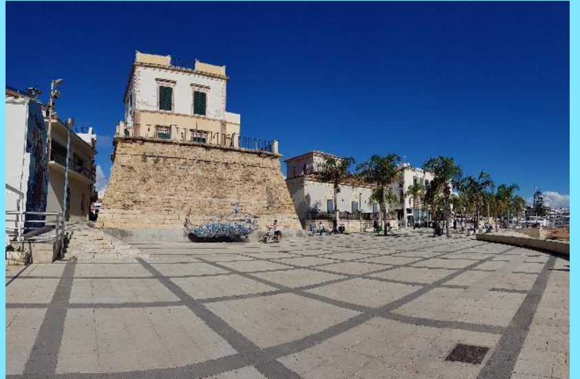
2. November 2019 Super Ausflug mit dem Velo und dem Chari der Küste entlang nach Marina di Ragusa . Wirklich ein sehr schönes Hafenstädtchen.